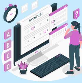
Online Test Series & Quiz