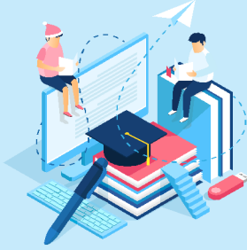
Books & Study Material