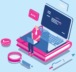
Live/Recorded Online Program